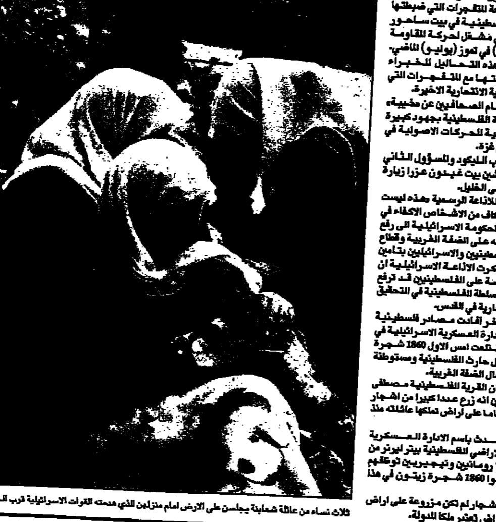
ثلاث نساء من عائلة شامية يجلسن على الارض امام منزلهن الذي هدمته القوات الاسرائيلية قرب الخليل (دعوات)

مسؤولون اسراييليون يزورون الخليل للتحقق من تطبيق اتفاق اعادة الانتشار ومقتل جندي في اجتياح شاحنة فلسطينية حاجزا في مدينة بيت لحم